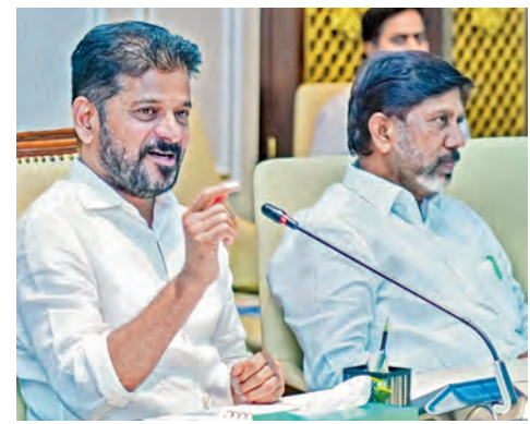
సోమవారం సచివాలయంలో ఇందిరా స్త్రీశక్తి భవనాలకు శంకుస్థాపన చేస్తున్న సి.ఎం రేవంత్. చిత్రంలో డి.సి.ఎం భట్టి ప్రభాతవార్త ప్రధాన ప్రతినిధి, హైదరాబాద్, మే 25: 2034 నాటికి కోటి మంది మహిళలకు కోటి శ్రుంగులుగా చెన్నై ముఖ్యమంత్రి ఎ.రేవంత్ రెడ్డి సుస్థం చేశారు. మహిళా శక్తి దేశానికి ఆదర్శంగా నిలబెట్టడమే ప్రజా ప్రభుత్వ సంకల్పమని అన్నారు. 'మహిళలు ఆర్థికంగా నిలబడితే కుటుంబం నిలబడుతుంది, కుటుంబం నిలబడితే గ్రామం బలపడుతుంది, గ్రామం

ఒకే రోజు 8 వేల ఇందిరా స్త్రీశక్తి భవనాల నిర్మాణానికి శంకుస్థాపన త్వరలో మహిళలకు కార్పొరేట్ సూపర్ బజార్లు, లాజిస్టిక్ హబ్లు, రైస్ మిల్లులు సచివాలయం నుంచి వర్చువల్ గా శంకుస్థాపన చేసిన సి.ఎం రేవంత్ మహిళలకు ఇందిరమ్మ చీరల అందజేత